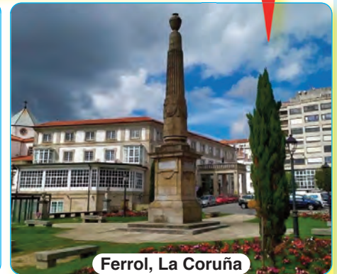
Ferrol, La Coruña