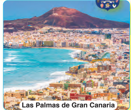
Las Palmas de Gran Canaria