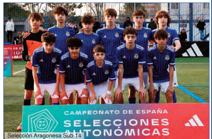
Selección Aragonesa Sub 14

Aprovecho esta ocasión para desearles, en mi nombre y en el de todos los integrantes de la RFAF, para todos los que formamos el fútbol aragonés, a los clubes, dirigentes, entrenadores, deportistas, árbitros, patrocinadores, y todos los colaboradores un muy FELIZ AÑO 2026 , en el que seguiremos trabajando por y para el fútbol aragonés.