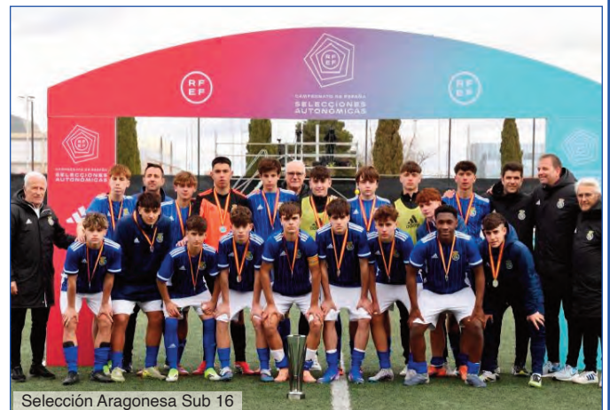
Selección Aragonesa Sub 16