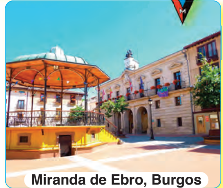
Miranda de Ebro, Burgos