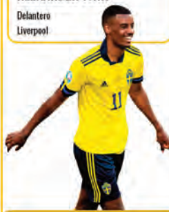
FIGURA DEL EQUIPO ALEXANDER ISAK Delantero Liverpool

Selección física y competitiva. Destaca por el juego directo y la fortaleza aérea.