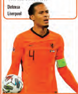
FIGURA DEL EQUIPO VIRGIL VAN DIJK Defensa Liverpool

Selección técnica y equilibrada. Destaca por la posesión, la presión alta y la organización táctica.