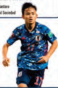
FIGURA DEL EQUIPO TAKEFUSA KUBO Delantero Real Sociedad

Equipo veloz y disciplinado. Baza su juego en la movilidad ofensiva y la intensidad colectiva.